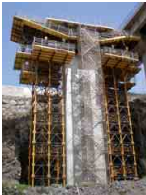
Cimbra T-500 en ejecución de dintel