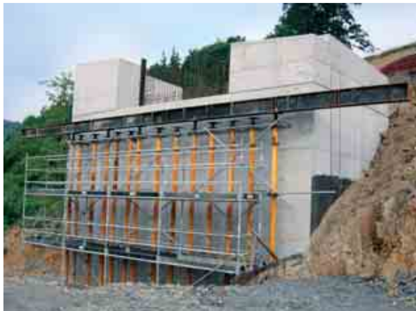
Solución de puntal con T-500