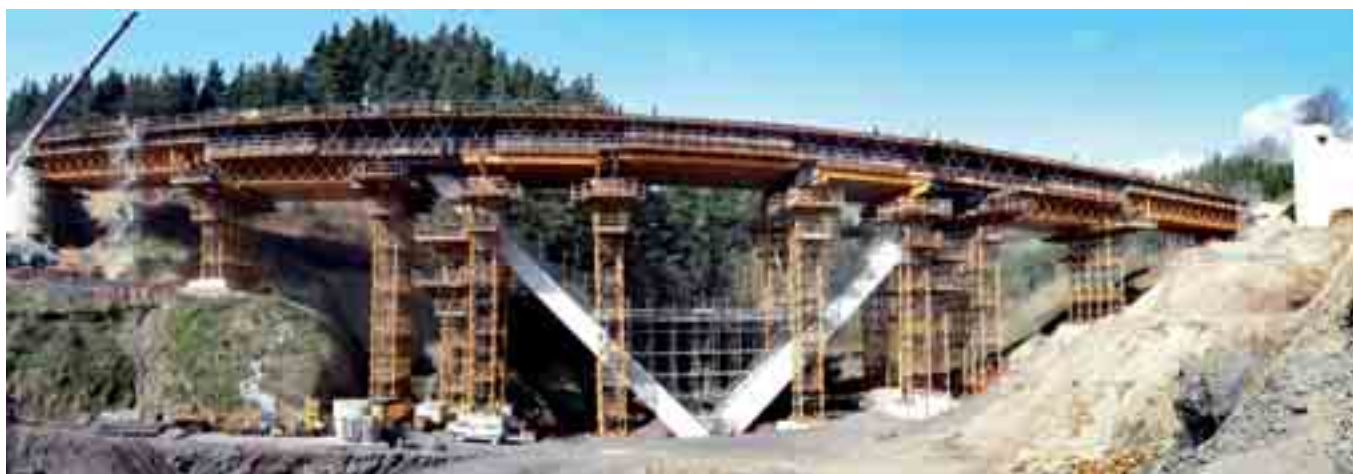
Cimbra T-500 en el Viaducto de Basagoiti, Aretxabaleta, España